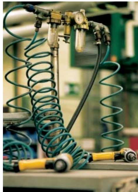
Abb. 3: Energie-„Vernichter“ im Druckluftnetz

Grosse Querschnittstoleranzen, mehr Kupplungen als nötig, zuviel Tüllen und falsche Schlauchdurchmesser summieren sich zu einem grossen Energie-„Vernichter“. Passende Konfektionierung zahlt sich fast immer aus.